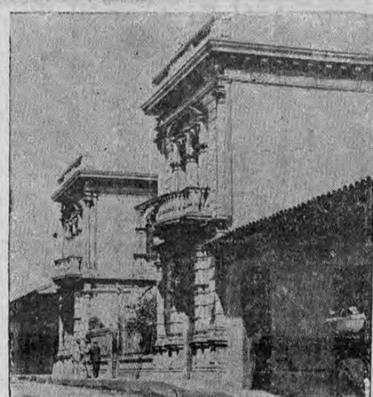
VISTA de la Legación de los Estados Unidos en Managua, Nicaragua, la cual se encuentra actualmente resguardada por los marinos americanos después del levantamiento en el cual 8 marinos fueron muertos. La lucha resultó de un movimiento que se dice encabezado por el General Sandino.

EL SR. MORA APARECE COMPLICADO EN LA FALSIFICACION DE CINCO VIGESIMOS DE LA LOTERIA NACIONAL JUGADA EL PRIMERO DE ENERO